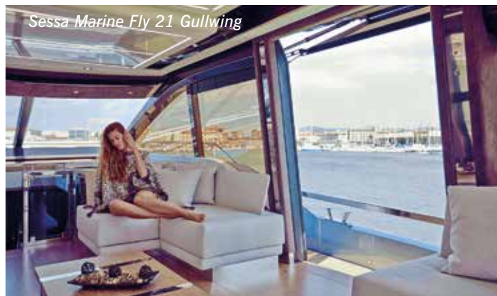
Sessa Marine Fly 21 Gullwing

trature in sovrastruttura e sullo scafo, non disattende il nostro ideale.