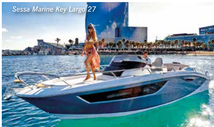
Sessa Marine Key Largo 27