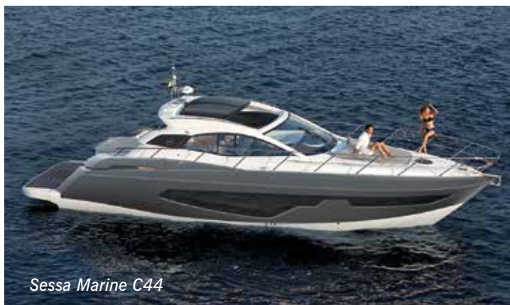
Sessa Marine C44