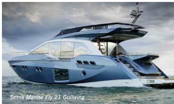
Sessa Marine Fly 21 Gullwing